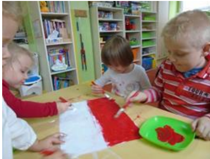
Poznawanie barw narodowych