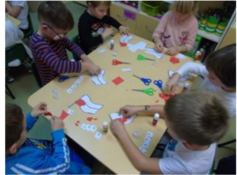
Analiza i synteza głoskowa wyrazu FLAGA