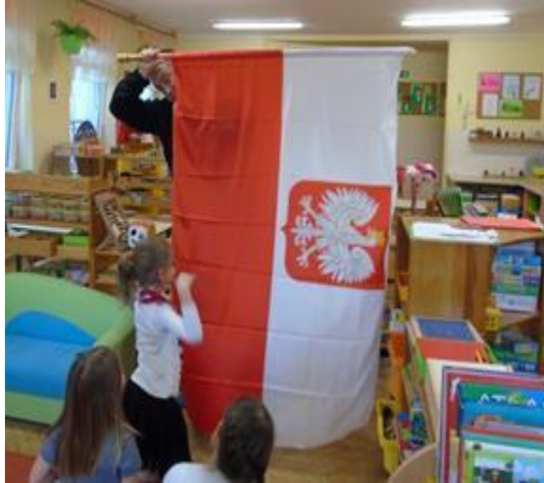
Przygotowanie do wymarszu na wspólne śpiewanie HYMNU