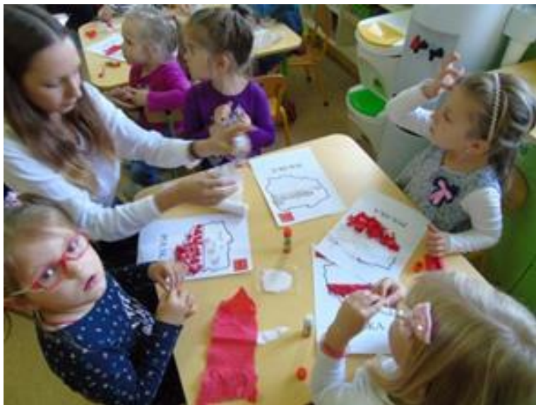
Wypełnianie konturu Polski barwami narodowymi