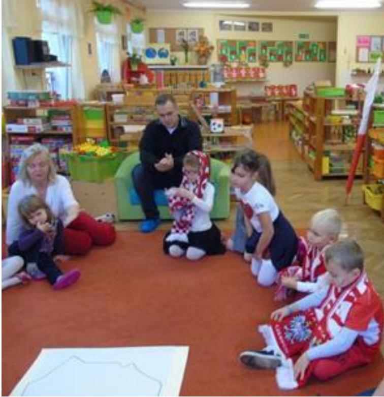
Wspólne filozofowanie na temat : „Co to jest - niepodległość”