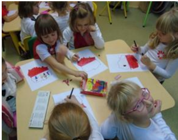
Rysunek rodziny w konturze Polski