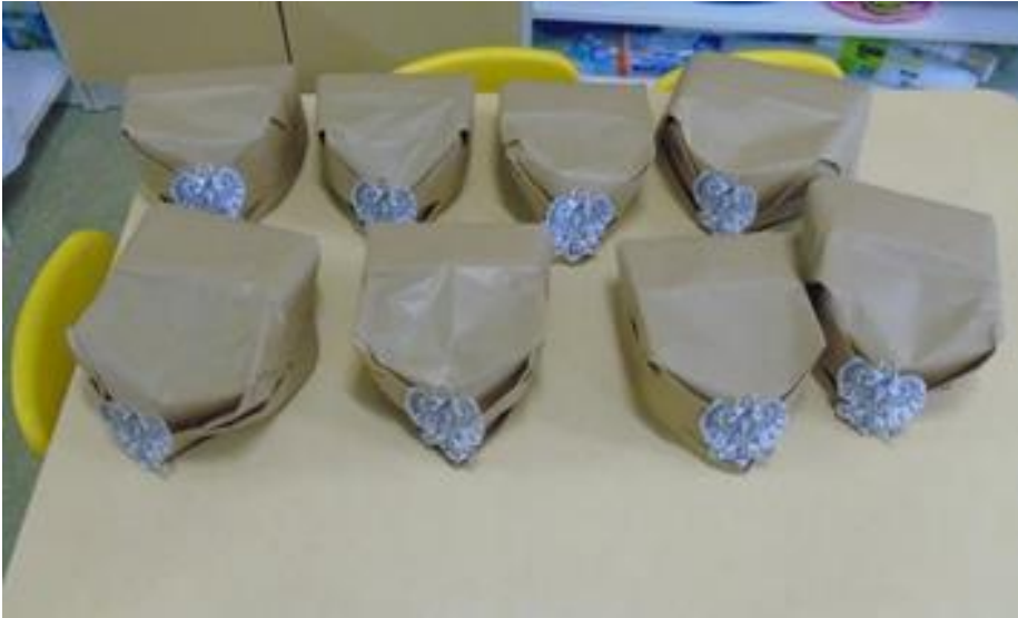
Czapki rogatywki zrobione wspólnie z przybyłymi na tę okazję rodzicami