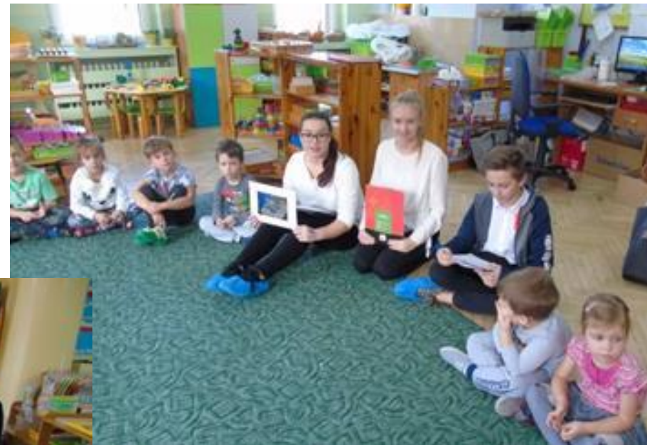
Uczniowie w swych opowiadaniach przybliżyli dzieciom postacie sławnych Polaków – F. Chopina i M. Kopernika.

Uczniowie klasy VIII A Szkoły Podstawowej 110, przeprowadzili zajęcia edukacyjne dla przedszkolaków.