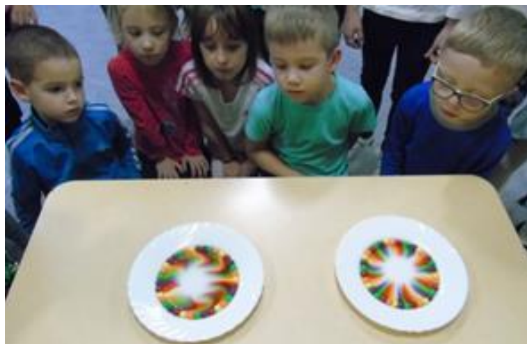
Doświadczenia z kolorami

Maria Curie-Skłodowska Mikołaj Kopernik Fryderyk Chopin