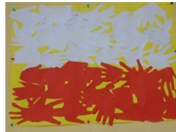
Nasza flaga z naszych dłoni