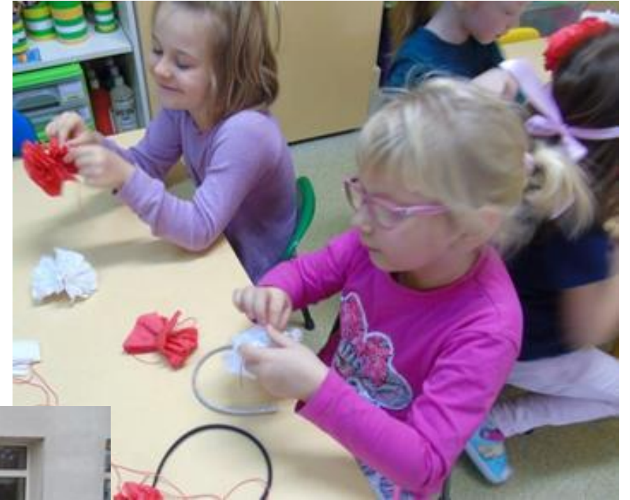
Dziewczynki samodzielnie przygotowały kotyliony w barwach narodowych