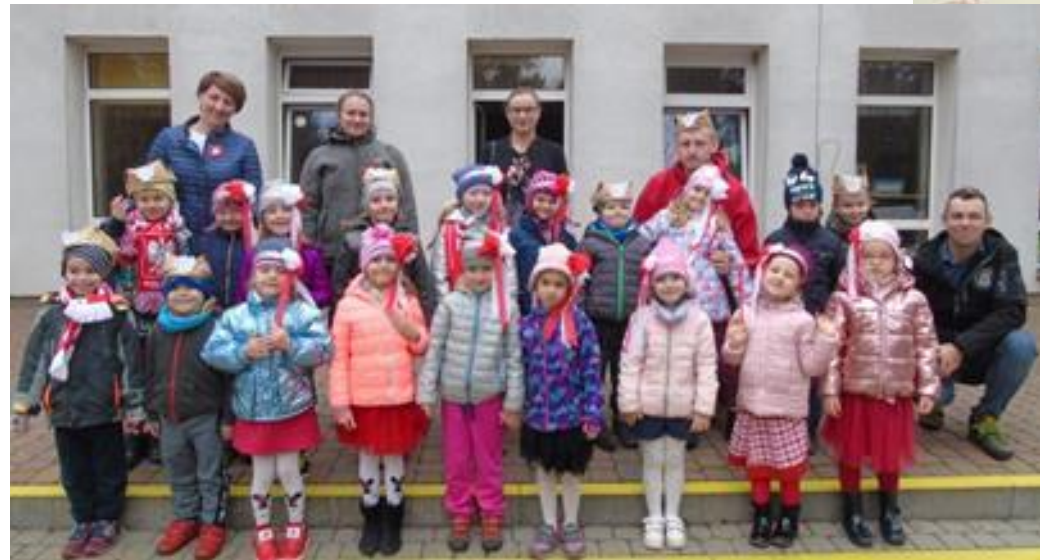
Tak prezentowały się dzieci z grupy V z rodzicami w gotowych ozdobach