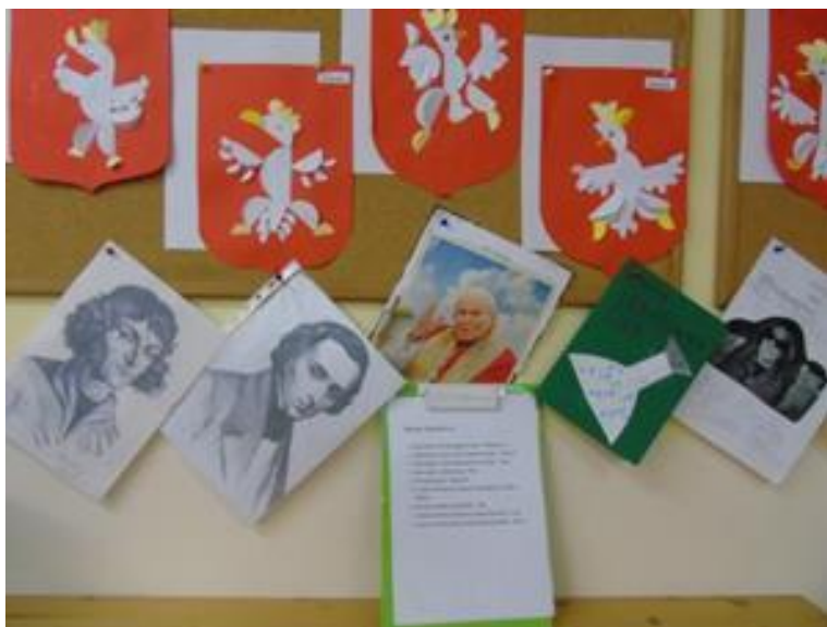
Poznajemy Sławnych Polaków