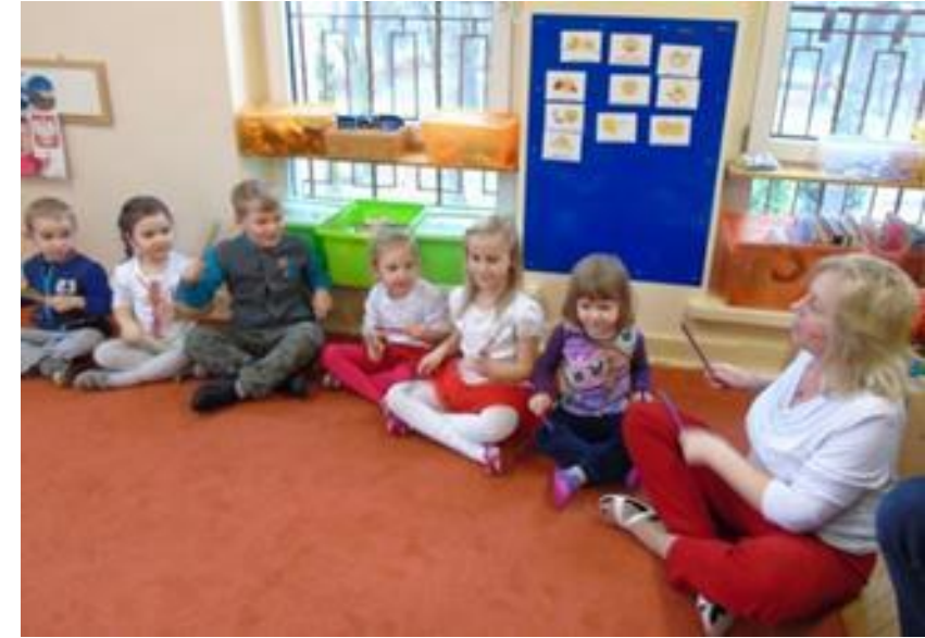
Rytmiczne wystukiwanie piosenki „Biel i czerwień” o barwach narodowych i godle