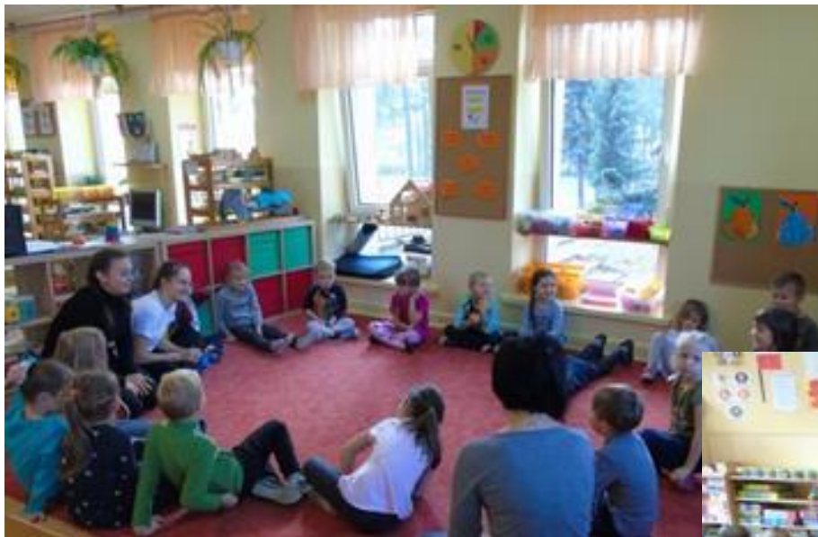
Dzieci wysłuchały „Legendę o powstaniu Gniezna .

Uczniowie klasy VIII A Szkoły Podstawowej 110, przeprowadzili zajęcia edukacyjne dla przedszkolaków.