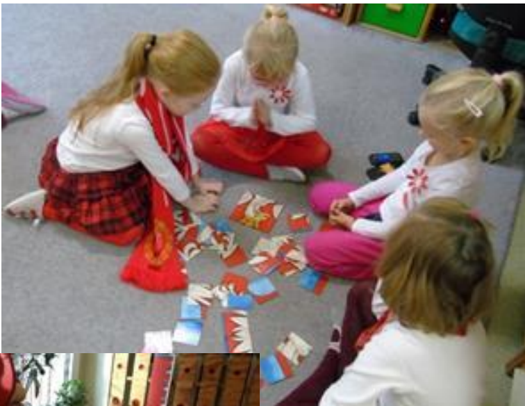
Tworzenie Godła różnorodnymi technikami