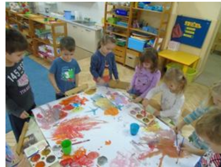
Malowanie farbami do muzyki F. Chopina